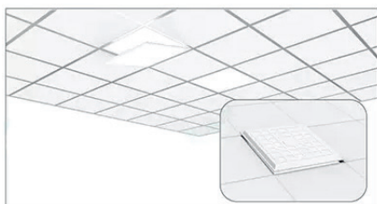
Empotrada en techo desmontable