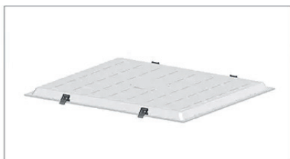
Empotrada en techo estándar*